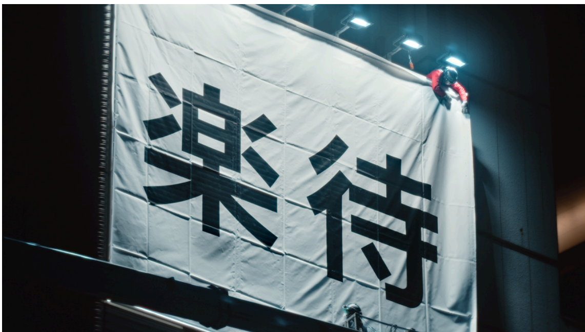
2026年1月には、実際に看板を設置する様子を撮影した 楽待の新CM を公開

さらに、2024年3月から東京都内（新宿・渋谷・恵比寿）で屋外看板広告の掲出を開始。2024年11月には渋谷駅周辺と埼玉県、岐阜県にも拡大し、2026年5月25日には関西エリア初となる大阪市内への掲出を予定しているなど、街中での接点拡大にも取り組んでいます。