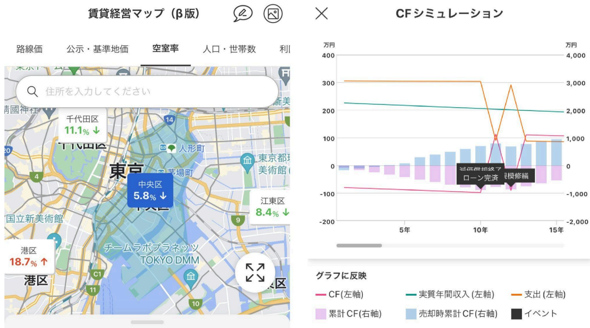
左が「賃貸経営マップ」、右が「キャッシュフローシミュレーション」の利用画面

「賃貸経営マップ」では、「空室率」「ハザードマップ」「路線価」などといった賃貸需要の見極めに必要なさまざまな指標を、地図上で一括チェックできます。「キャッシュフローシミュレーション」はPC版でも人気の機能で、「物件購入後、手元にいくら残るか」を50年先までシミュレーションしてくれます。