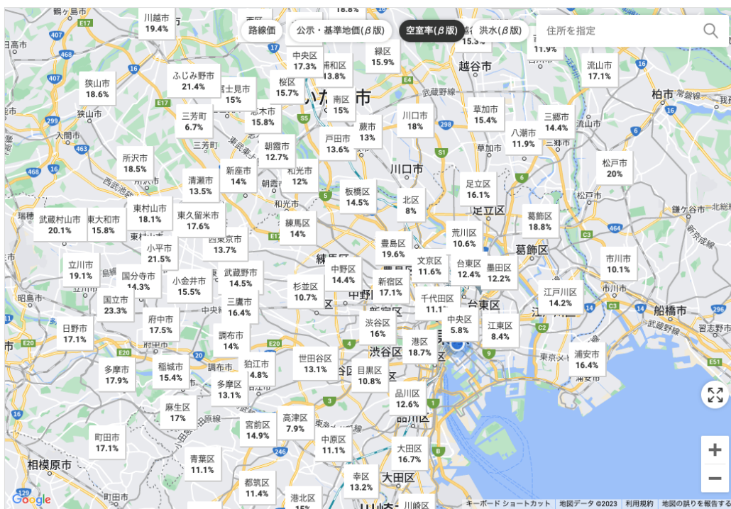
パソコン画面では、空室率を一度に100個表示できる

画面に表示できる空室率は、アプリ版だと20個でしたが、Web版では100個まで表示することができます。賃貸経営では、空室が増えるほど家賃収入が減少します。物件購入後の稼働率を高めるためには、エリアの空室率は重要な判断指標の1つとなります。今回のアップデートで、大きな画面で複数エリアの同時比較が可能となり、迅速な投資判断に役立てていただけます。